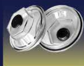
Oil Bath Dust Caps