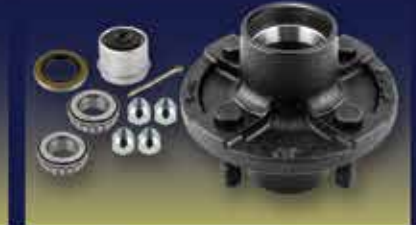
Trailer Hub Kits