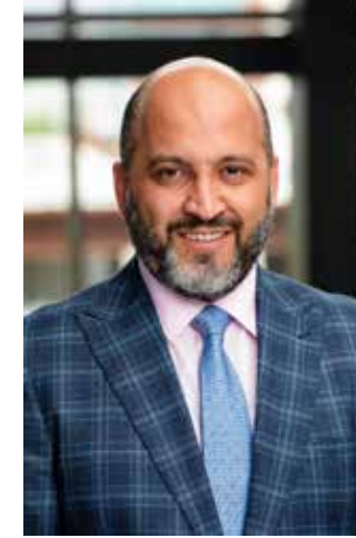
بقلم المحامي ربيع الحموي

معظم وثائق التأمين على الممتلكات الشخصية أو التجارية تحتوي على العديد من الواجبات والالتزامات التي تسمى "الشروط" التي يجب على صاحب بوليصة التأمين الالتزام بها ولا قبل ان يتمكن من التحصيل على تعويضه، أو مقاضاة شركة التأمين لخرق عقد التأمين.